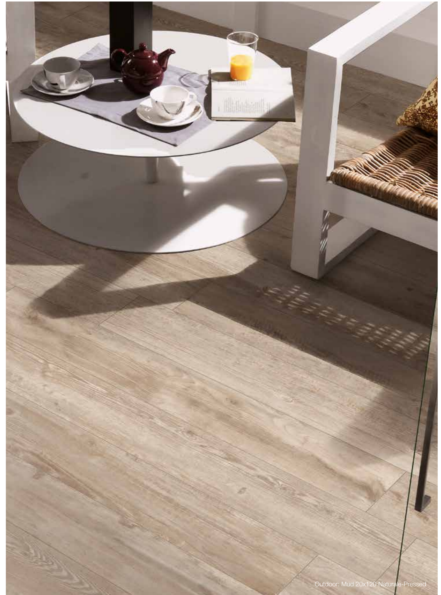
Outdoor: Mud 20x120 Naturale-Pressed

179881 - Ice 179883 - Smoke 179882 - Sand 179884 - Mud