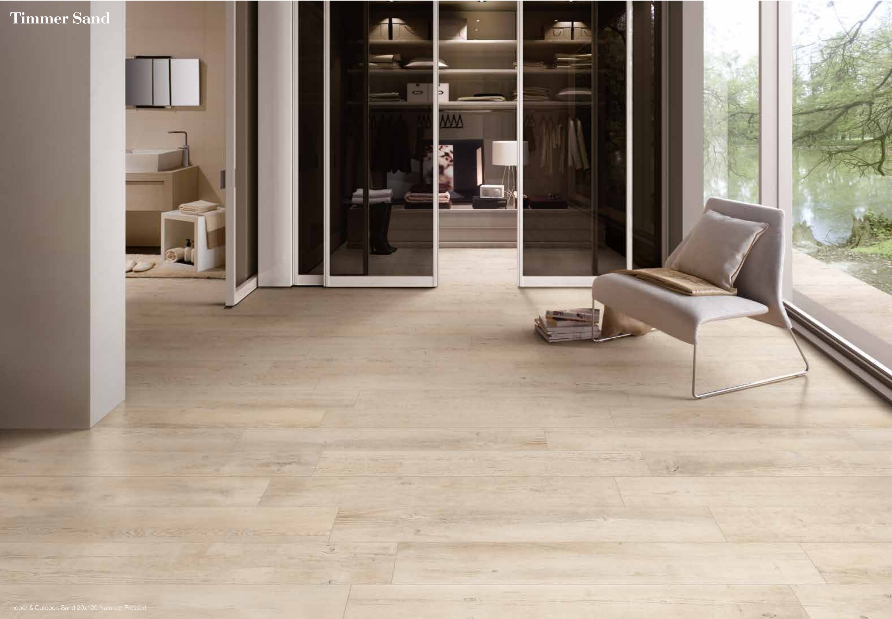
Indoor & Outdoor: Sand 20x120 Naturale-Pressed