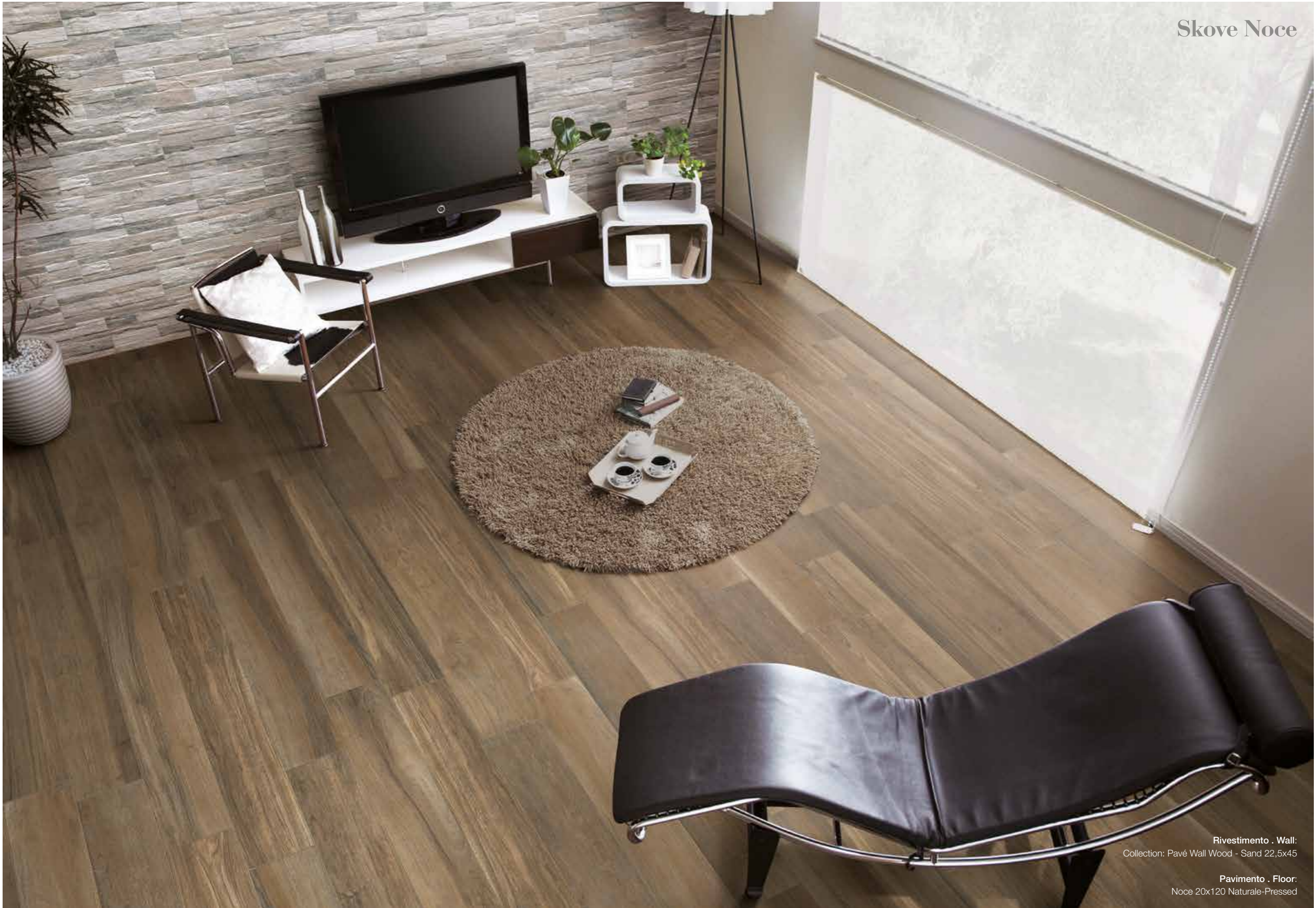
Rivestimento . Wall: Collection: Pavé Wall Wood - Sand 22,5x45