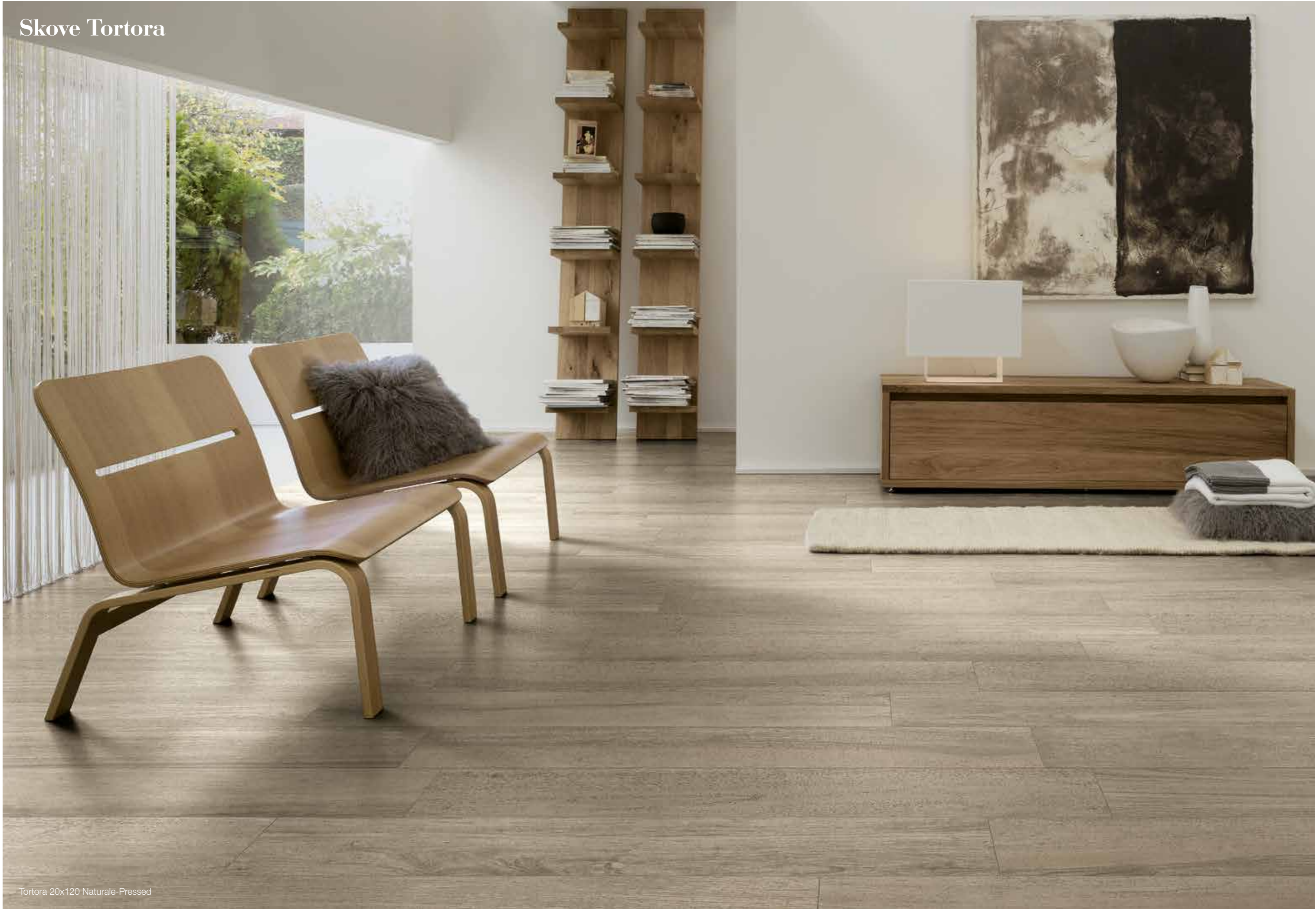
Tortora 20x120 Naturale-Pressed