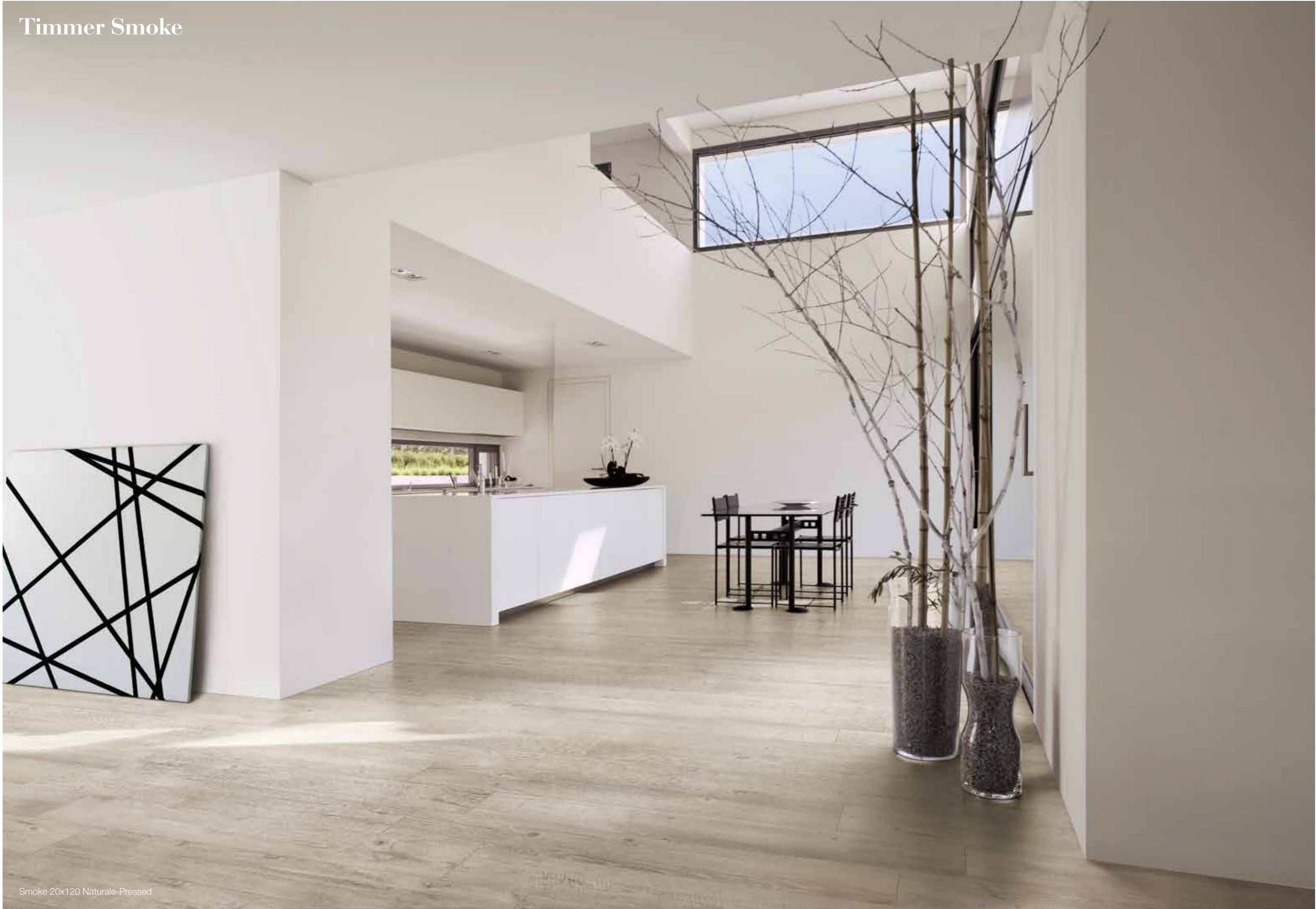
Smoke 20x120 Naturale-Pressed