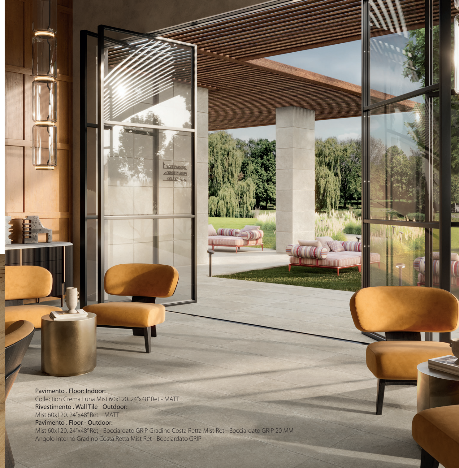
Pavimento . Floor: Indoor: Collection Crema Luna Mist 60x120 - 24"x48" Ret - MATT Rivestimento . Wall Tile - Outdoor: Mist 60x120 - 24"x48" Ret - MATT Pavimento . Floor - Outdoor: Mist 60x120 - 24"x48" Ret - Bocciardato GRIP Gradino Costa Retta Mist Ret - Bocciardato GRIP 20 MM Angolo Interno Gradino Costa Retta Mist Ret - Bocciardato GRIP