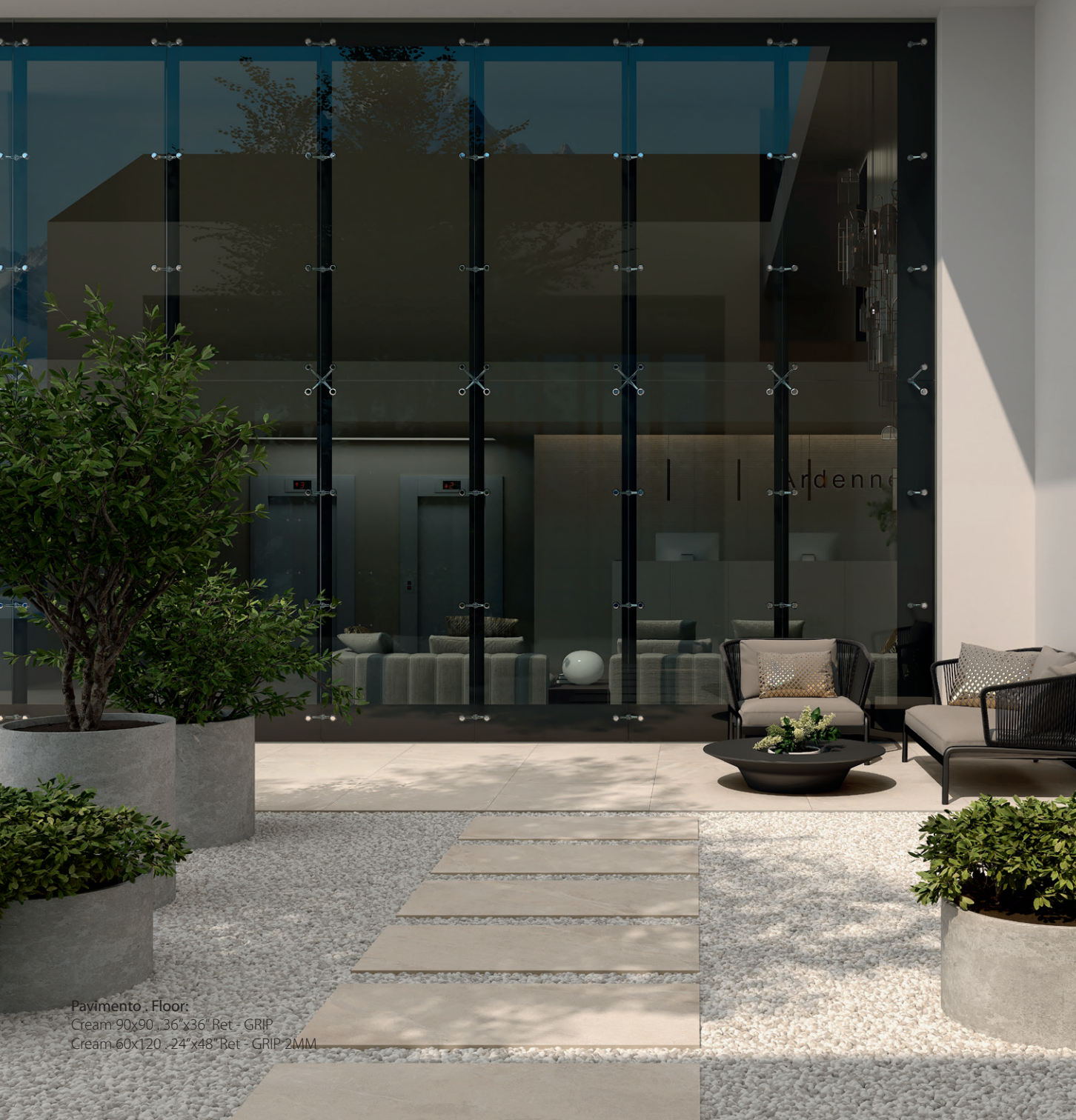
Pavimento . Floor: Cream 90x90 . 36"x36" Ret - GRIP Cream 60x120 . 24"x48" Ret - GRIP 20MM

L'alto spessore consente una maggiore versatilità di posa. Diventa quindi la soluzione perfetta per tutti gli ambienti in esterno sia quelli che consentono l'uso di collanti, sia quelli con fondi in terra, ghiaia o sabbia.