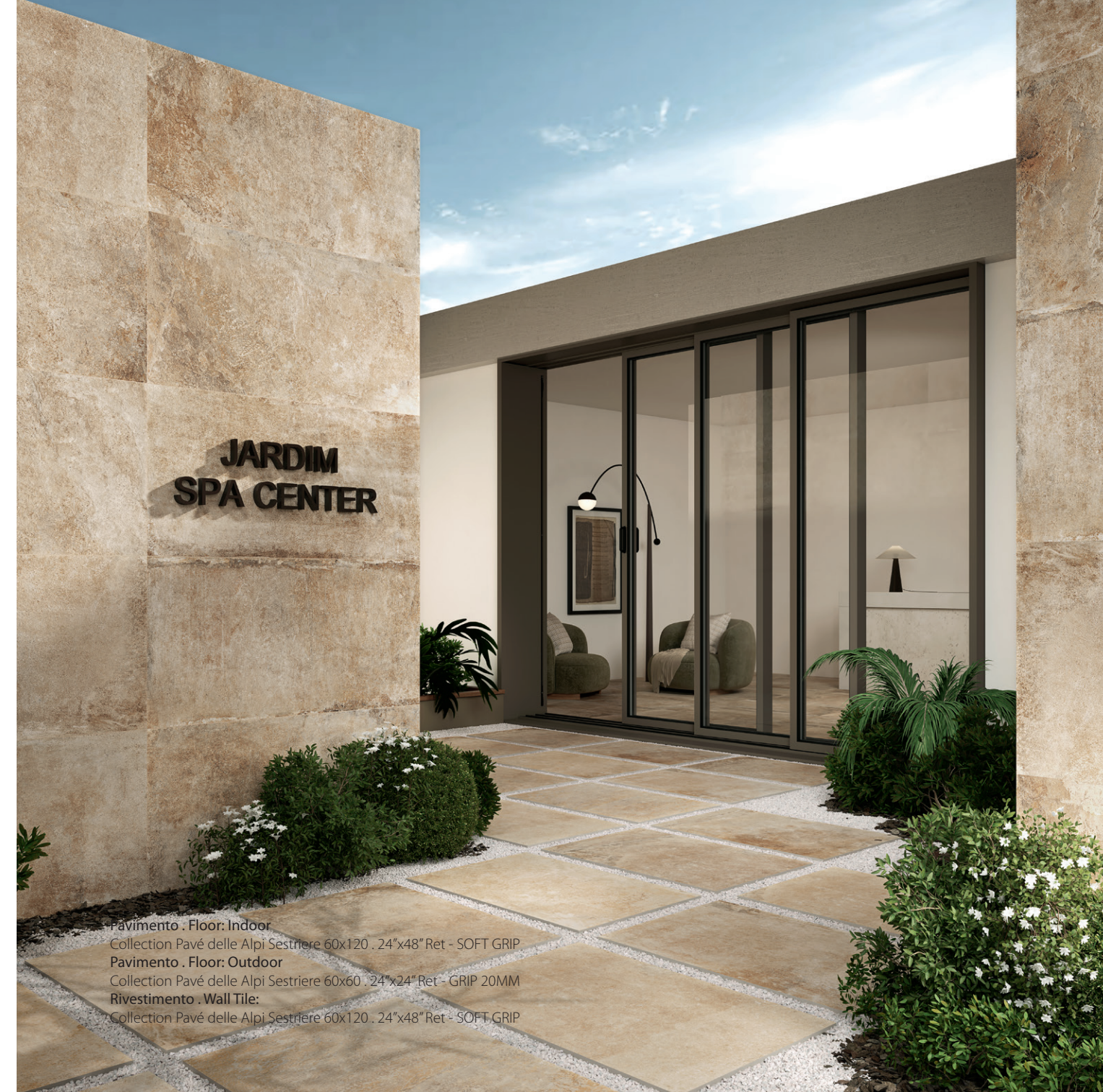
Pavimento . Floor: Indoor Collection Pavé delle Alpi Sestriere 60x120 . 24"x48" Ret - SOFT GRIP Pavimento . Floor: Outdoor Collection Pavé delle Alpi Sestriere 60x60 . 24"x24" Ret - GRIP 20MM Rivestimento . Wall Tile: Collection Pavé delle Alpi Sestriere 60x120 . 24"x48" Ret - SOFT GRIP