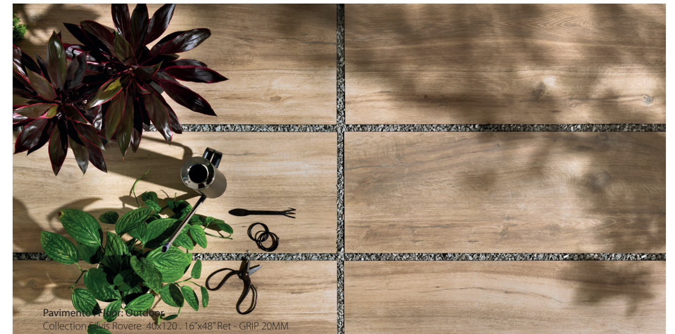
Pavimento . Floor: Outdoor Collection Crema Luna Rovere 40x120 - 16"x48" Ret - GRIP 20MM