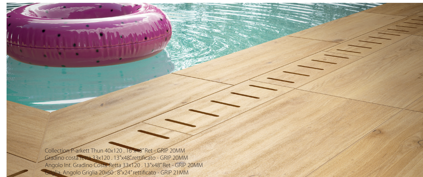
Collection Parkett Thun 40x120 - 16"x48" Ret - GRIP 20MM Gradino costa lucida 33x120 - 13"x48" rettificato - GRIP 20MM Angolo Int. Gradino Costa Retta 33x120 - 13"x48" Ret - GRIP 20MM Griglia Angolo Griglia 20x60 - 8"x24" rettificato - GRIP 21MM