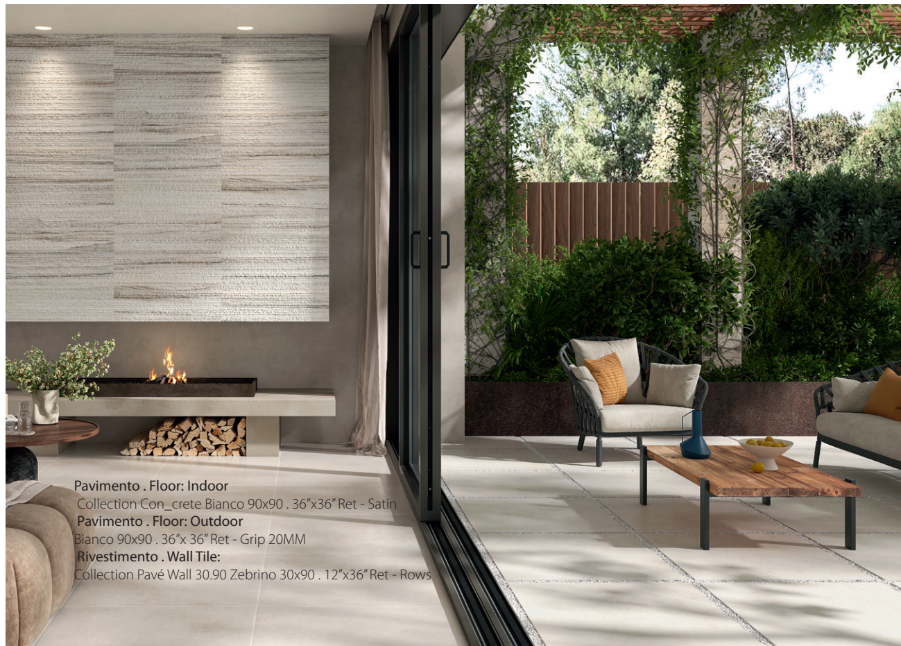
Pavimento . Floor: Indoor Collection Con_crete Bianco 90x90 . 36"x36" Ret - Satin Pavimento . Floor: Outdoor Bianco 90x90 . 36"x 36" Ret - Grip 20MM Rivestimento . Wall Tile: Collection Pavé Wall 30.90 Zebrino 30x90 . 12"x36" Ret - Rows

La méthode traditionnelle de collage permet d'obtenir des surfaces extrêmement résistantes, idéales pour les zones soumises au passage et au stationnement de véhicules à moteur. Les dalles de 20 mm peuvent également être intégrées à des systèmes de support surélevés.